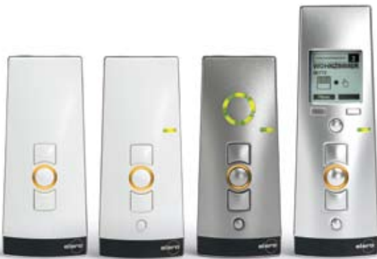
MonoTel 2 LumeroTel 2 VarioTel 2 MultiTel 2

A ProLine 2 távirányítók és a mágneses falitartók formatervezett kivitelben fehér, ezüst és titánszürke színben kaphatók.